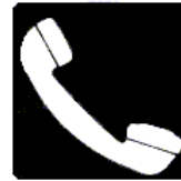
Teléfono de salvamento